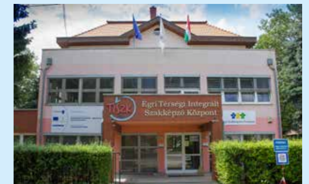
Egri Térségi Integrált Szakképző Központ Nonprofit Kft. (Egri TISZK)