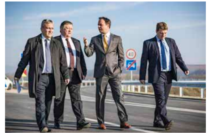
M25, északi ütem