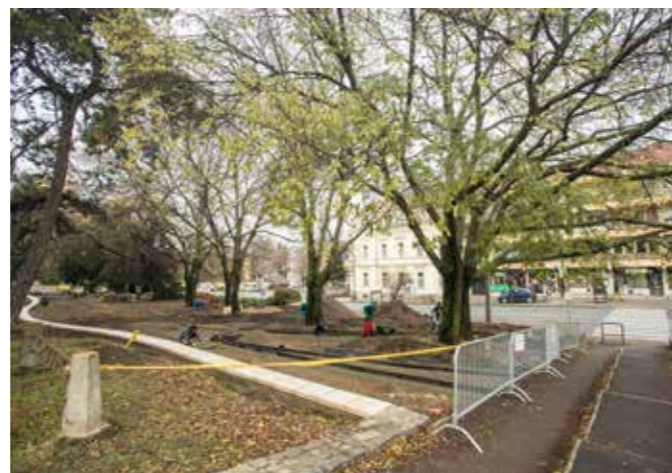
Hatvani kapu tér

– Fontos döntések születtek e téren. Örömmre szolgál, hogy egyrészt rendbe tettük a városfalat, másrészt a vasútvonalhoz közel eső, s a kazamata-rendszerrel összefüggésben álló Zárkány-bástyát is látogathatóvá te-