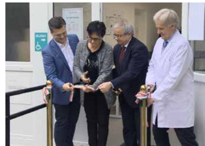
Megújult orvosi rendelő átadása, Napsugár utca (ÁPRILIS)

- Amennyire megbecsült tagjai a fiatalok egy családnak, úgy a társadalom alapkövei az idősök. Eger Önkormányzata 2017-ben Idősbarát Önkormányzat lett, s en-