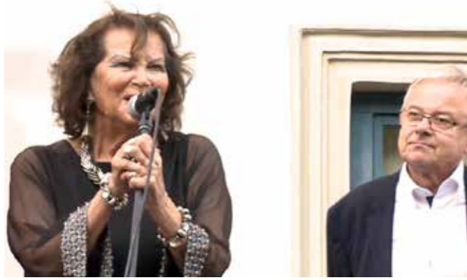
Claudia Cardinale, Egeri Klasszikus Film Maraton (SZEPTEMBER)