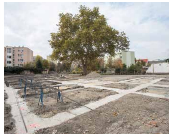
A Kertész úti új óvoda alapjai

- Egyrészt úgy lehetünk családbarátok, hogy jó színvonalú, és korszerű gyermekintézményeket működtet az önkormányzat, illetve rendre ilyen fejlesztéseket is megvalósítunk. Köztudomású, hogy az előző években valamennyi bölcsődénk megújult, valamint férőhelyet is bővítettünk. 2018-ban elkezdtük az első új óvoda építését a Kertész úton, s ezt idén, a Lajosvárosban is követi egy új gyermekintézmény építése. Folytatjuk az óvodai felújításokat, korszerűsítéseket is, ám a családbarát gyakorlat nem csupán ebből áll. Olyan, talán jelképesnek mondható, de kedves és értékrendet felmutató gesztusok is ide tartoznak, mint a házasságok megajándékozása, vagy éppen a babacsomag bevezetése január 1-jétől.