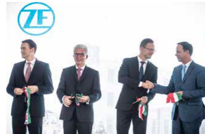
A ZF új üzemcsarnokának avatása

– Rengeteg munkával támogattuk a ZF Hungaria új üzemcsarnokának létesítését, s ezzel csaknem 800 új egri munkahely létrejöttét. Különböző kedvezményekkel és pénzügyi szerepvállalással is helytálltunk, mert éreztük, hogy ez kulcsfontosságú kérdés az egri jövő szempontjából. A kormányzat maximálisan mellénk állt, hiszen nem csupán az történt, hogy nemzetgazdasági szempontból kiemeltté nyilvánították ezt a beruházást, hanem pénzügyi támogatásban is részesítették a ZF-bővítést. Úgy vélem, egy igazi ünnep volt Eger számára 2018-ban, amikor a beruházóval és a külgazdasági és külügyminiszter úrral együtt egy 40 000 m 2 -es csarnokot adhattunk át a rendeltetésének. A stratégiai cél szerint a cég alkalmazotti létszáma megduplázódik, a termelését pedig néhány év alatt megötszörözik. Ez nagyon fontos a műszaki értelmiségnek és fontos az egri és térségbeli fiatalok számára is. Adott a munkalehetőség, érdemes szakirányú képzésekben gondolkodni és persze mindez az adóbevételek szempontjából is jelentős pluszt ad a város számára, ami már néhány éves távlatban is növeli a gazdasági mozgásterünket. Nem véletlen talán, hogy a Magyar Fejlesztési és Befektetési Ügynökség „Az év munkahelyteremtő beruházása” címmel jutalmazta a közös munka eredményét. A Polgármesteri Hivatalban dolgozó kollégák, az Egeri Városfejlesztési Kft., a MÁV és a különböző állami szervek együttműködését