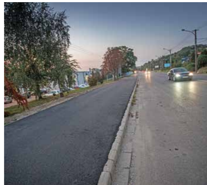
Kerékpárút – Kistályai út

– Az ütemtervnek megfelelően, jól halad a Kistályai úti kerékpárút- és járdaépítés. Fontos ez a fejlesztés, mellyel a munkába járás biztonságát és lehetőségeit javítjuk. Különös értelmet nyer mindez akkor, ha visszaemlékszünk arra, hogy szeptember 6-án avatták fel a ZF Hungária Kft. 800 új munkahelyet teremtő, 40 ezer négyzetméteres, új gyárcastronokát. Reményeink szerint az eddig a déli iparterületen működő vállalkozásokhoz további befektetők is csatlakoznak még, így a Kistályai úti járda és kerékpárút építése nagyon sok egeri polgár és munkavállaló számára jelent majd valós, hasznos alternatívát a mindennapos közlekedésben.