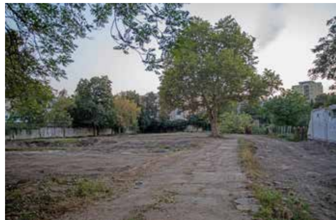
Kertész út 100. – a régi hajléktalanszálló területe

– Talán nincs ilyen, hiszen a tervezett fejlesztéseink minden városrészt és minden ágazatot érintenek. Szó esett ipari- és közlekedési infrastruktúráról, a szociális szféráról, sportról, turisztikáról, az egészségügyi alapellátásról is. Ami például kulcsfontosságú előrelépés az elmúlt időszakhoz képest: elhárult minden jogi akadály a komplex egészségügyi központ építése elől, így a Lajosvárosban egy minden igényt kielégítő, 21. századi szolgáltató ház jön létre. Itt kap majd helyet két felnőtt és két gyermekorvosi körzeti rendelő, valamint egy védőnői tanácsadást ellátó szakmai csoport. Volt azonban más, komoly kihívást jelentő feladat, hiszen mindez a jelenleg még működő, Köztársaság téri óvoda helyén épül fel, így a gyermekek ellátásáról, a szülőkkel és a dolgozókkal egyeztetve, megnyugtató módon kell gondoskodnunk. Tudjuk, hogy minden szülő számára