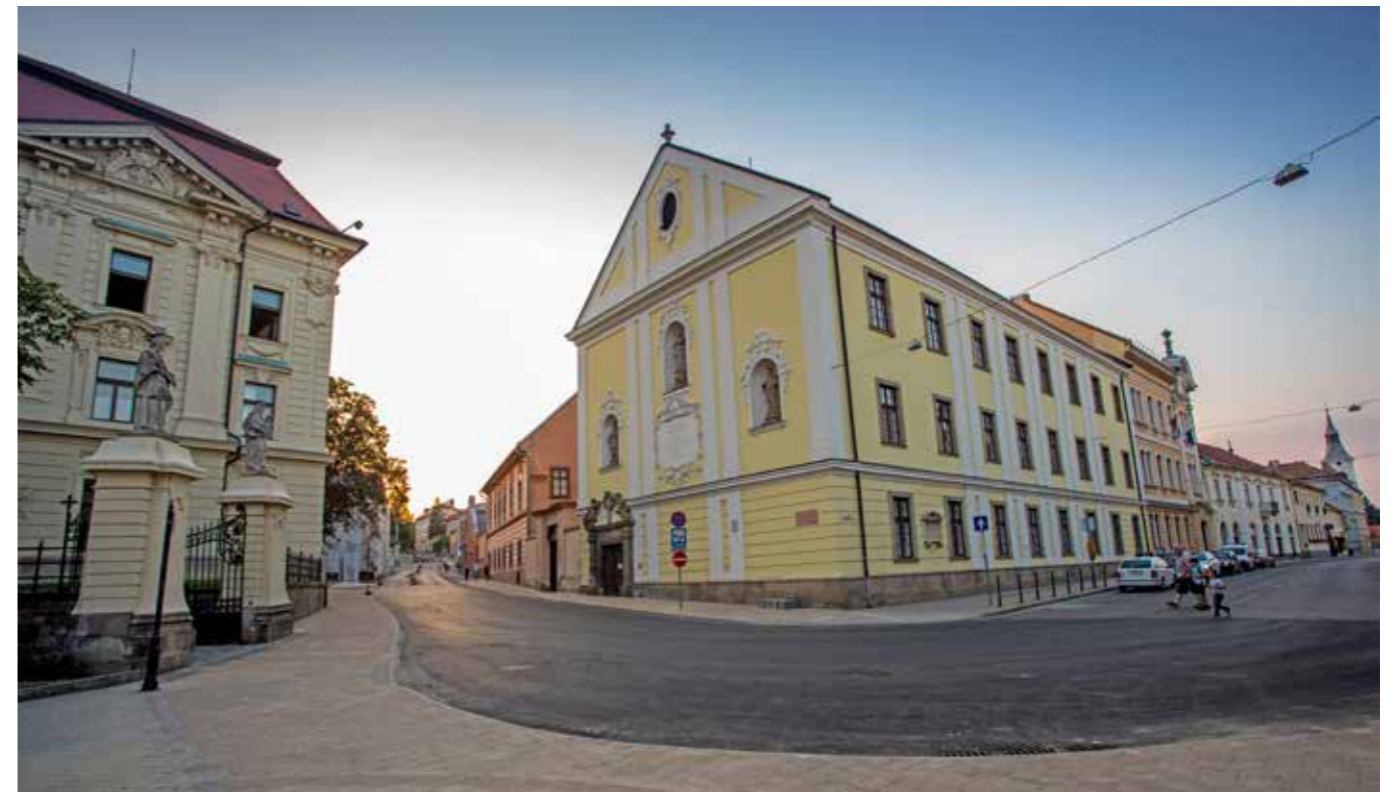
Csiky Sándor utca

– A Kertész út 100. szám alatt ugyancsak egy teljesen