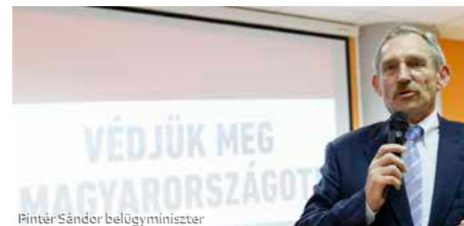
Pintér Sándor belügyminiszter

Az utóbbi időben szinte minden a népszavazásról, a migrációról szól, sokan sokféleképpen vélekednek. Egerben és a környező településeken is többször lehetett hallani a témáról. Az utóbbi hetekben Nyitrai Zsolt országgyűlési képviselő, miniszteri biztos meghívására többek mellett Pintér Sándor Magyarország belügyminisztere, Hende Csaba országgyűlési képviselő, volt honvédelmi miniszter, Erdős Norbert Európa parlamenti képviselő, valamint Bakondi György a miniszterelnök belbiztonsági főtanácsadója is kifejtette véleményét az Európai Bizottság által kezdeményezett kötelező betelepítési kvótával kapcsolatban.