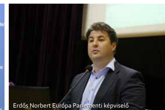
Erdős Norbert Európa Parlamenti képviselő