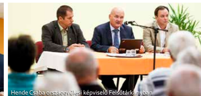
Hende Csaba országgyűlési képviselő Felsőtárkányban