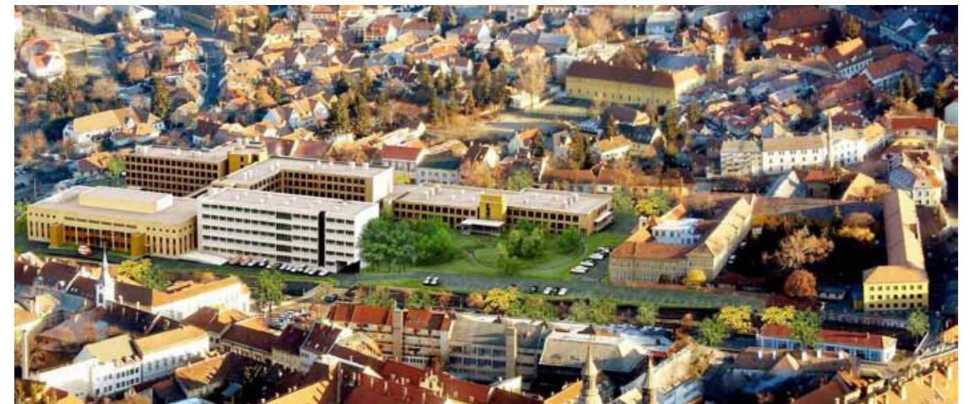
A megújult kórház a város szívében

2016 januárjától teljesen megújult műszerparkkal áll a betegek szolgálatában a kórház, a Radiológiai osztály az új technológiai tömbben, korszerű körülmények között, új gépekkel fogadja a betegeket, megszűnik a több telephelyes elhelyezés, a hagyományos, filmes alapú analóg technika, új alapokra helyeződik a radiológiai diagnosztika. Néhány hónapon belül befejeződik a több milliárdos beruházás a Markhot Ferenc Kórházban, a fejlesztések révén a gyógyító munka színvonalasabbá válhat.