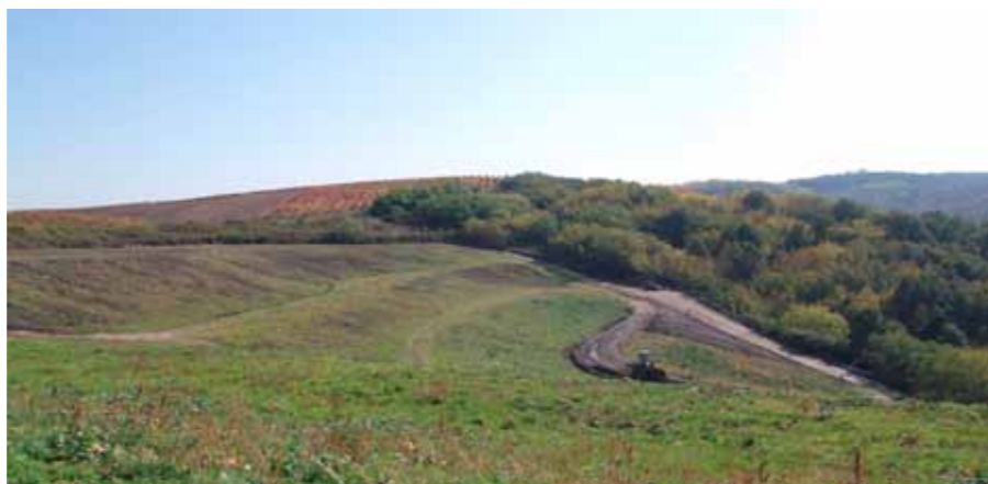
Ilyen volt és ilyen lett az egri lerakó

lése után építhető meg, miután a gázképződés befejeződött. Ezt az időintervallumot a környezetvédelmi határozat írja elő. Az átmeneti záró rendszer megépítése után is szükséges az utógondozás, mely az átadás után önkormányzat/társulás feladata.