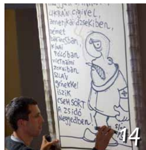
Kultúrszalon – idén folytatódik